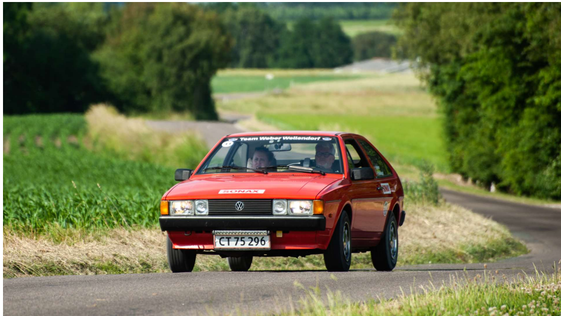
Torben Weber Andersen med datteren Emilie Weber Wellendorf som kortlæser gennemførte Djursland Løbet som bedste mandskab totalt, og blev dermed også vinder af Sport-klassen.